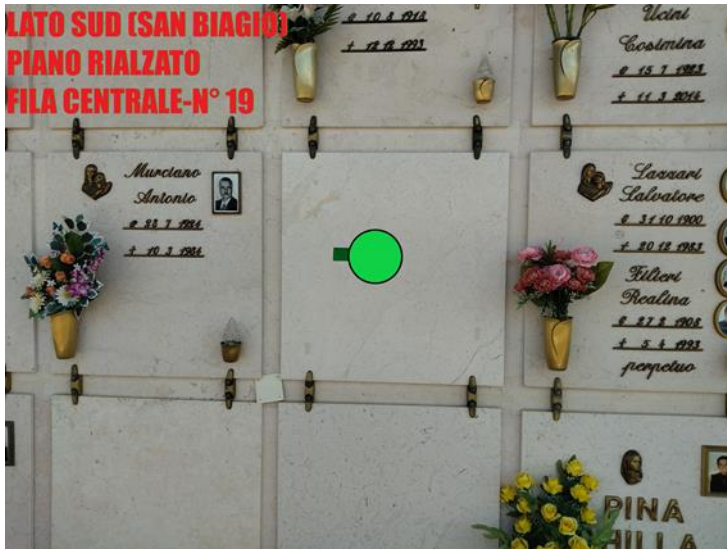
LATO SUD (SAN BIAGIO) PIANO RIALZATO FILA CENTRALE-N° 19