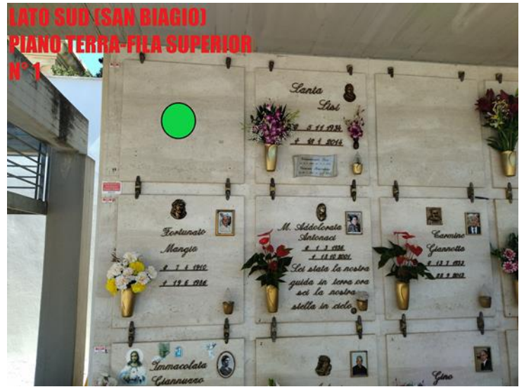
LATO SUD (SAN BIAGIO) PIANO TERRA-FILA SUPERIOR N° 1