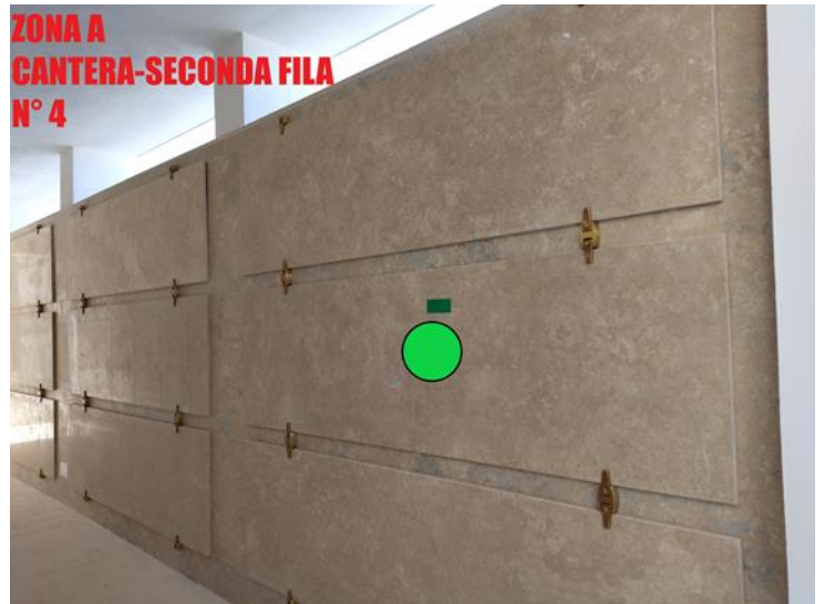
ZONA A CANTERA-SECONDA FILA N° 4