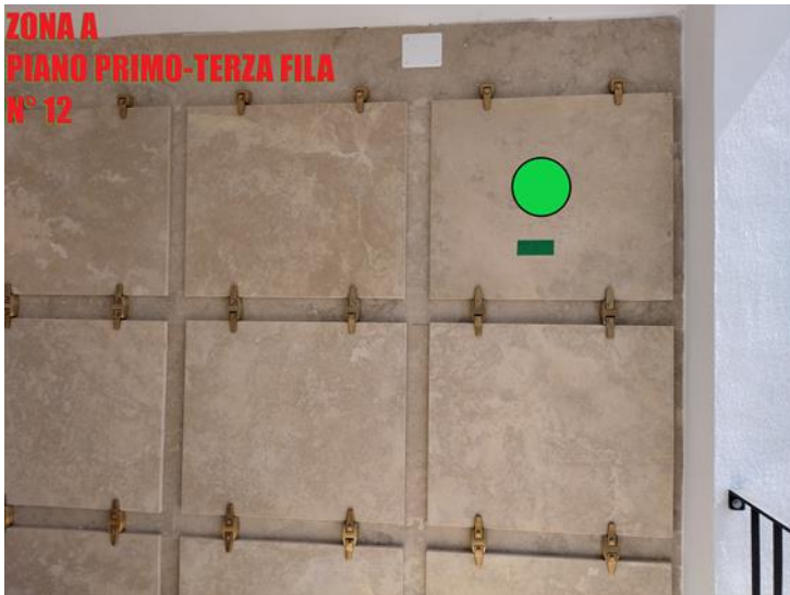
ZONA A PIANO PRIMO-TERZA FILA N° 12