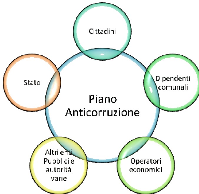
Figura 1- Piano anticorruzione comunale e portatori di interessi